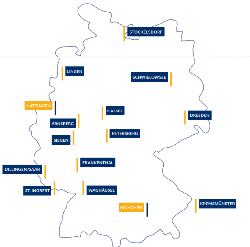
德国本土培训中心分布

ISO 9712 for all industrial sectors and level 1, 2 and 3 Ultrasonic Testing, TOFD, Phased Array, Radiographic Testing, Digital Radiography, Film Evaluation, Magnetic Particle Testing, Penetrant Testing, Visual Testing, Leak Testing, Eddy Current Testing, Infrared Thermographic Testing